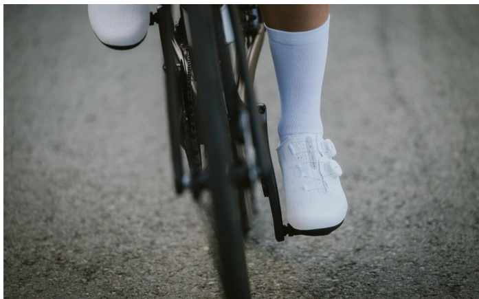
VAN RYSEL FAHRRADSCHUHE RCR

Zwei Belüftungsöffnungen an der Sohle sorgen für eine bessere Luftzirkulation.